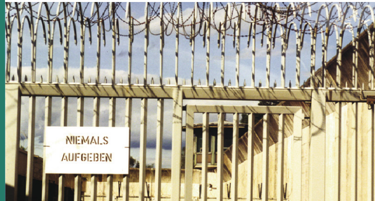
Aufnahme anlässlich einer Theateraufführung von Gefangenen in der JVA Salinenmoor